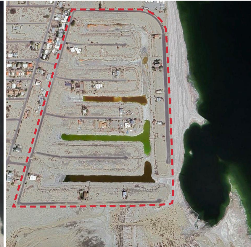
Fotos históricas de Google Earth